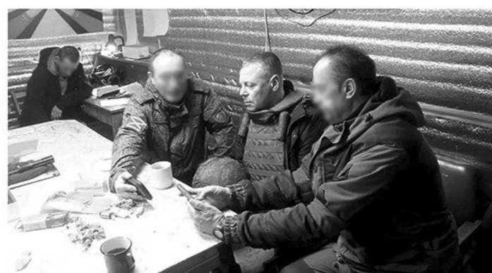
► Военные напоили губернатора чаем